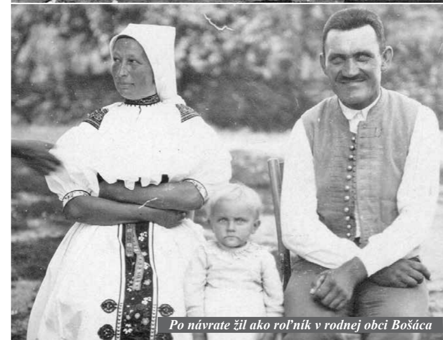
Po návrate žil ako roľník v rodnej obci Bošáca