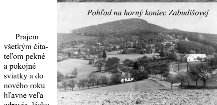
Pohľad na horný koniec Zabudišovej

Prajem všetkým čitateľom pekné a pokojné sviatky a do nového roku hlavne veľa zdravia, lásku a spokojnosť.