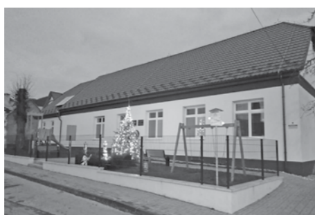
Zrekonštruovaný kultúrny dom

nie, pokiaľ sa my všetci budeme tváriť, že nevidíme tých, čo to robia. Zberné miesto by sme chceli otvárať dvakrát do týždňa a to v stredu a možno v sobotu. Dôvod nášho rozhodnutia? Kto chce, nech príde za mnou a ukážem mu len zopár fotiek a budete prekvapení, čo dokážeme urobiť pokiaľ to funguje na vzájomnej dôvere. Mrzí ma to, ale ešte sme nedospeli. Žiaľ.