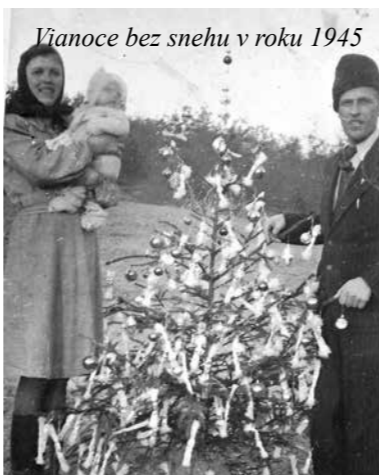
Vianoce bez snehu v roku 1945

Touto cestou chcem poďakovať všetkým občanom Zabudišovej, ktorí mi poskytli údaje o svojich rodinách a fotografie z rodinných albumov. Zároveň prosím, ak má ešte niekto staré fotografie zo Zabudišovej alebo jej občanov, aby tieto doniesol do knižnice alebo na obecný úrad.