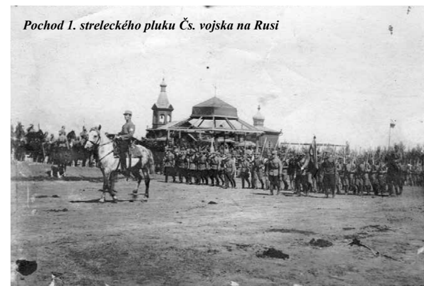
Pochod I. streleckého pluku Čs. vojska na Rusi

Zomrel 16. januára 1972 ako 80-ročný. Poslednej rozlúčky s ním sa zúčastnili aj členovia Československej obce legionárskej z Prahy. Pochovaný je na cintoríne v Bošáci.