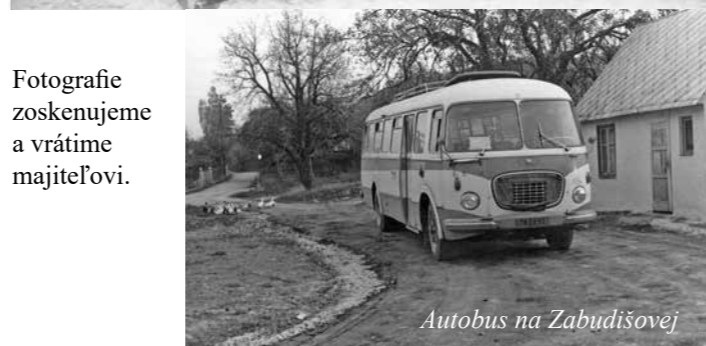
Autobus na Zabudišovej