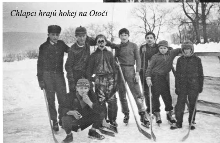
Chlapci hrajú hokej na Otoči